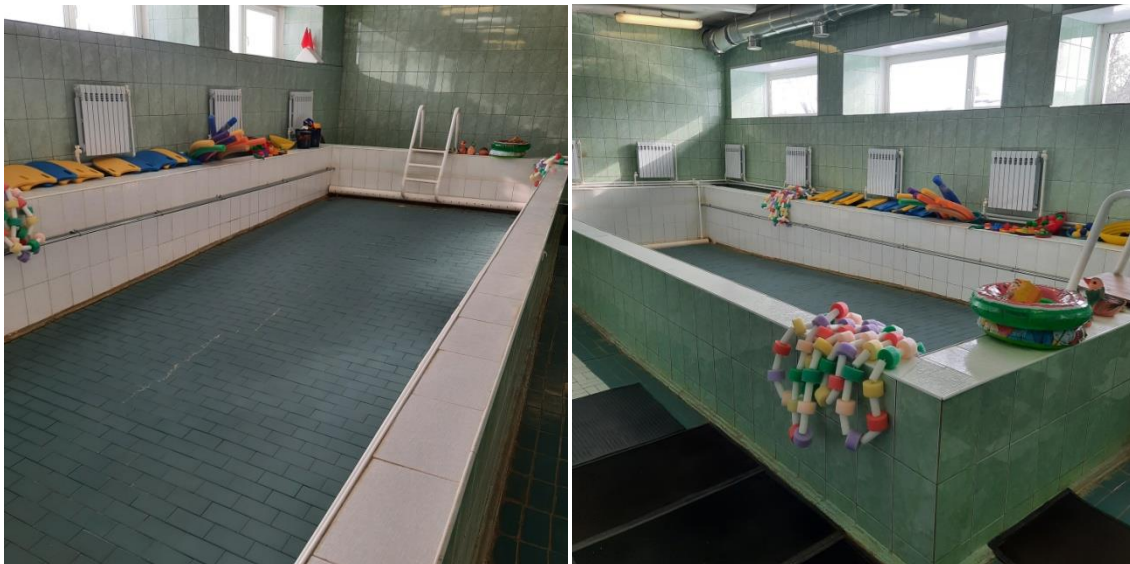
Игровое оборудование, разделительные дорожки.